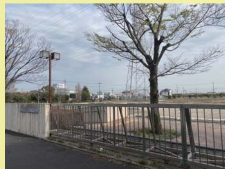
現在の温水プールの跡地