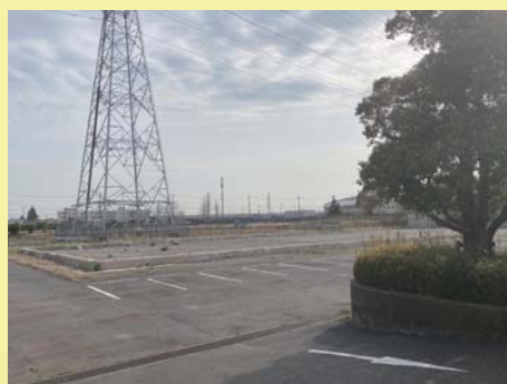
建物を撤去した段階で、一旦、工事中断です