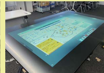
草加市災害情報共有システム