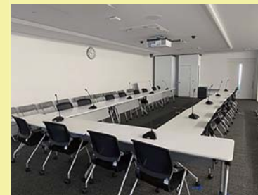
草加市役所8階 防災本部

本庁舎が被災し、使用することが出来ない場合につきましては、代替施設として、第2庁舎のほか、高砂小学校多目的室や、高砂コミュニティセンターが想定されております。