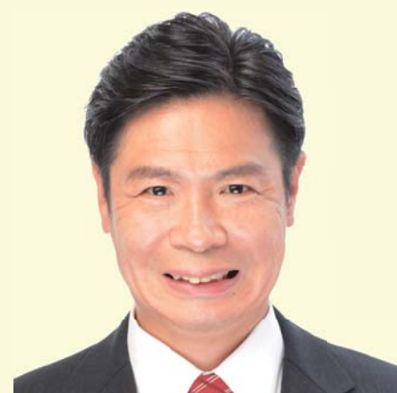
草加市議会議員 草加育ち