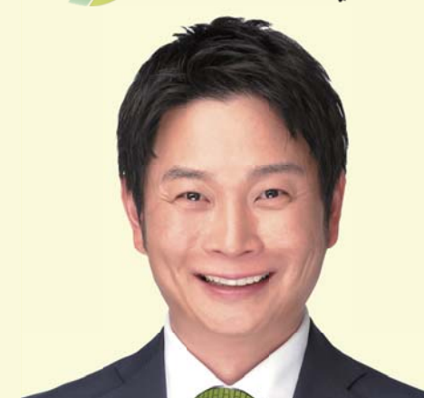
衆議院埼玉県第14選挙区 支部長 弁護士

私たちにあって、健康はかけがえないものです。健康は生活の原動力、家族の安心であり、それだけでも社会に貢献していると言えます。健康は私たちにあって最大の社会保障。青島健太は、全ての世代の健康を守り増進する「健康政策」に積極的に取り組んでまいります。