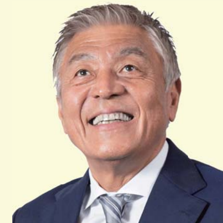
参議院議員 全国比例

昨年は、草加市の財政の在り方について重点的に取り組んでまいりました。現在、草加市の財政は「何に、どれだけ使うのか」を市民の皆様とともに見つめ直す、大切な過渡期にあると感じています。本年度も、皆様からの率直なご意見・ご提案を賜りますよう、どうぞよろしくお願い申し上げます。